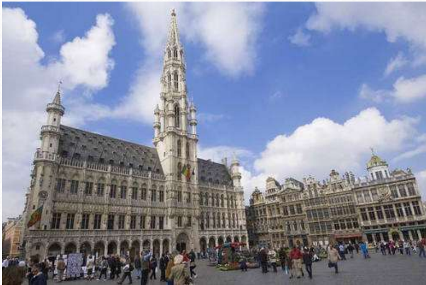
Bruxelles et sa Grand-Place